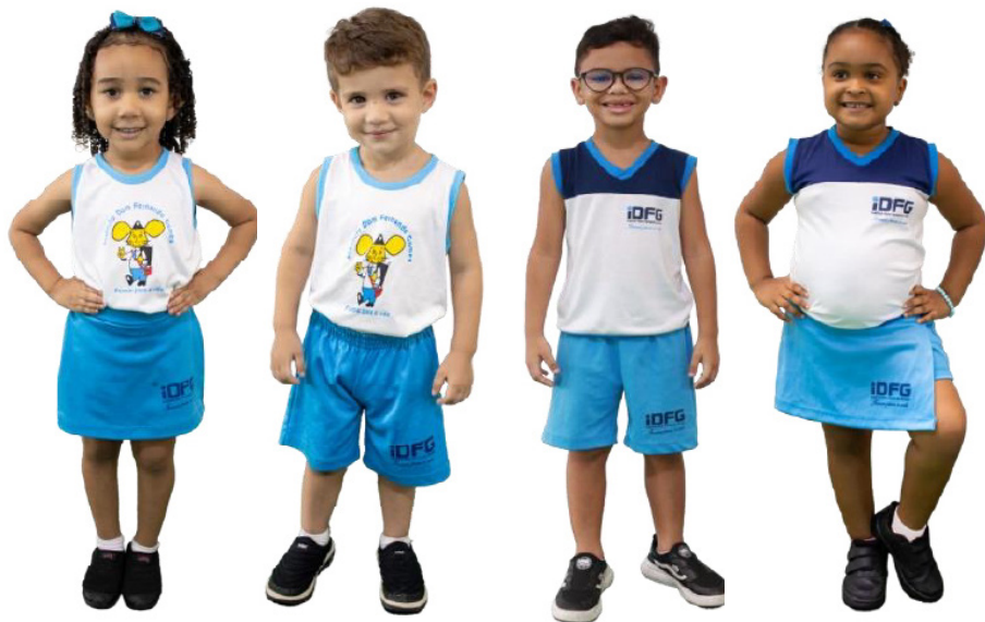
MATERNALZINHO - MATERNAL